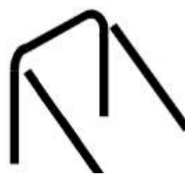
Principe 3 groupes loisir