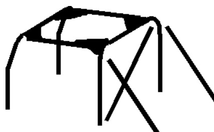
Principe 2 avec les goussets dans les angles