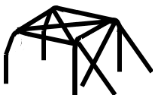
Principe 1 avec la croix en X

Les arceaux fabriqués à partir de coudes à souder sont interdits et devront être construits selon un des deux principes suivants (les tubes coudés sont néanmoins autorisés sur les tubes arrière) :