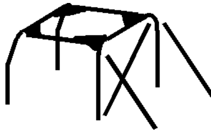
Principe 2 avec les goussets dans les angles